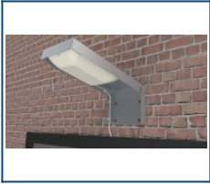
Кронштейн для настенного крепления Dioga Луна (комплект)